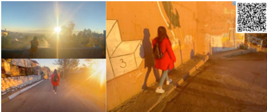
Fig. 2. Fotogramas de video y transcripción de fragmento de audio de biografía colectiva "Todas somos una", realizado por estudiantes de distintas pedagogías. Escaneando el QR se puede acceder al video.

se espera que es ser hombre y mujer era centro de burla diciéndoles "maricón o marimacho" (...) recuerdo que una vez estábamos haciendo un acto artístico en el colegio donde separaban a los hombres como piratas y a las mujeres como hadas. En ese momento me pusieron con los hombres con el argumento de que mi cuerpo era más parecido al de un pirata que al de una hada, debido a que tenía movimientos menos delicados, era gorda y alta, por lo que también asumieron que tenía más fuerza entonces podría levantar a mis compañeras (...).