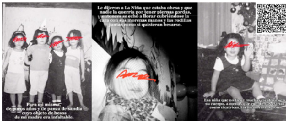
Fig. 1. Fotogramas de video de biografía colectiva "La niña" realizada por estudiantes de Psicología y Antropología. Escaneando el QR se puede acceder al video.

A continuación, abrimos una ventana a tres de las biografías colectivas audiovisuales realizadas a propósito de un curso de Pedagogías y Feminismos y de otro de Análisis de Productos Culturales. En ellos invitamos a les estudiantes a componer una crítica a distintos dispositivos de control deshumanizantes y deseocidas que quisieron o insisten en aniquilarlas, al menos, en sus memorias desde el presente.